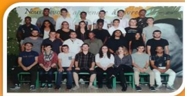
Promotion étudiants 2018-2019