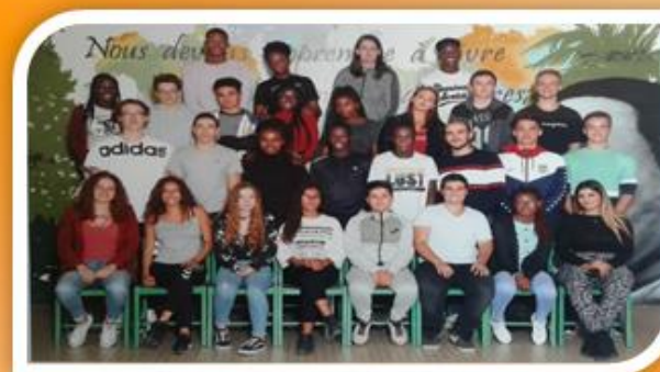
Promotion second cycle : 2018 - 2019